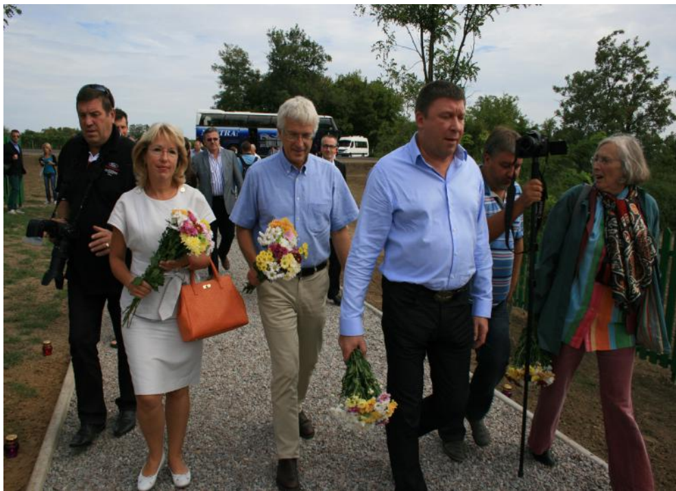
Madame la Conseillère d'État à Shabo en septembre 2012